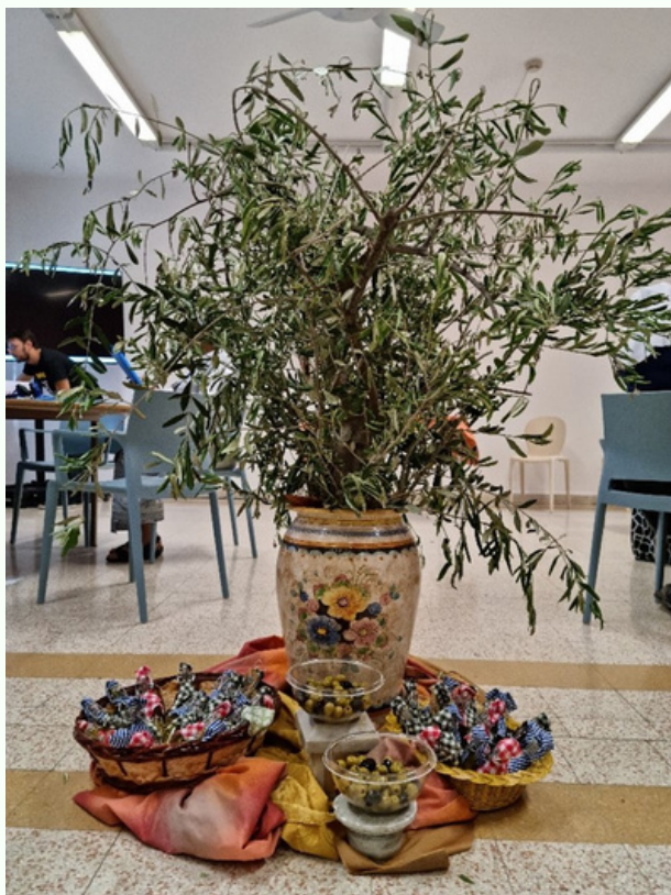
L'olivier, symbole de sagesse...